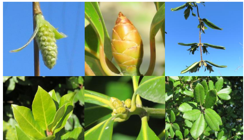
シングレヤナギの花 (上左) タブノキの冬芽 (上中) スイカズラの葉 (上右) ゲッケイジュの葉 (下左) マテバシイの冬芽 (下中) ウバメガシの葉 (下右)

普段あまり気にすることのない木を、ちょっと 気にしてみませんか？ いよいよ春、木の芽の様 子は？ もう花が咲いているのか？ もしかしたら 虫が隠れているかもしれません。春の樹木をじ っくり観察してみましょう。木にまつわる逸話は たくさんあります。動物とは、またちがった魅力 を楽しみましょう。