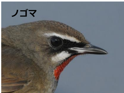
▲多くの小鳥は夜間に渡りをします。

多くの小鳥が夜間に渡りをするのに対し、ヒヨドリは昼間（主に午前中）に渡りをします。普段よりも少し控え目な声で鳴き交わしながら、林から林へ、短距離の移動を繰り返して旅をしていく様子が観察できます。外敵に襲われないよう、危険を察知すると直ぐに林の中に逃げ込みます。