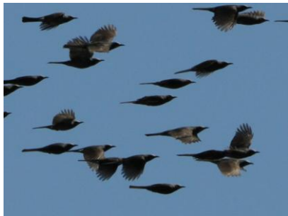
▲翼を閉じているのが滑空しているとき。