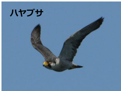
▲渡っている鳥にとって猛禽類は脅威です。