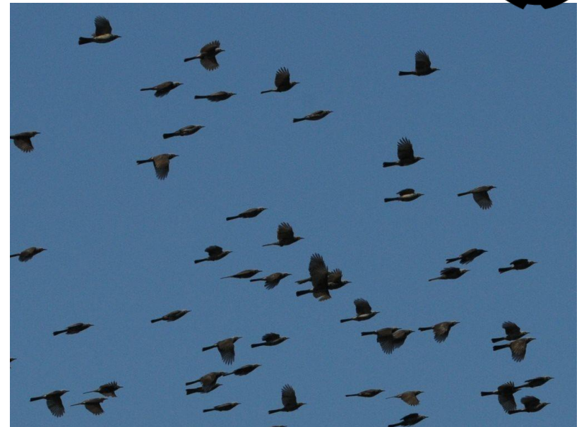
▲群れになって鳴き交わしながら移動するヒヨドリ。

渡り鳥は、毎年繁殖地と越冬地を往復する渡りを行います。秋になると、多くの渡り鳥が日本列島を南へ移動していきます。繁殖地から越冬地への秋の渡りです。