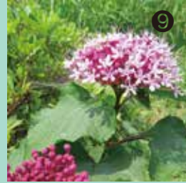
漁協前でみつけたボタンクサギの花