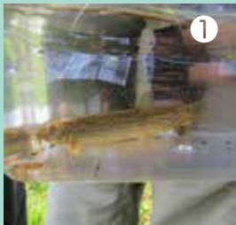
水路で見つけたドジョウ