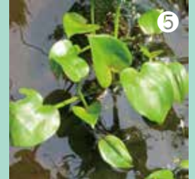
小さな紫色の花をつけるコナギ