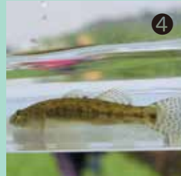
背びれと尾びれの付け根に黒いはん紋があるウキゴリ