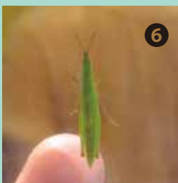
草むらで見つけたショウリョウバッタモドキ（幼虫）