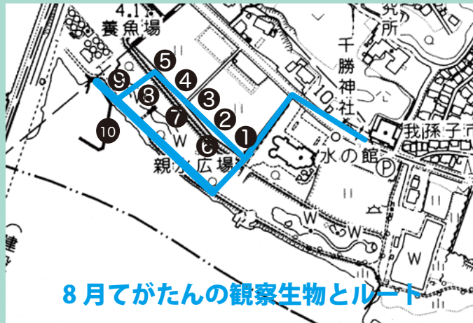
8月てがたんの観察生物とルート