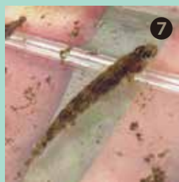
頭に赤い線があるヨシノボリの仲間（幼魚）