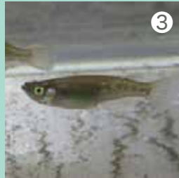
ミナメダカは群れで泳ぐ姿を観察