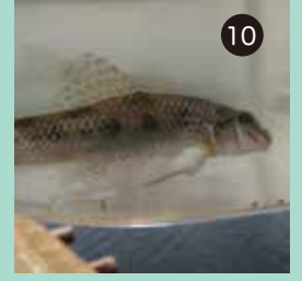
体の下に口があるツチフキ