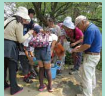
手賀沼ではモツゴ、タイリクバラタナゴ、ツチフキ、スジエビを観察