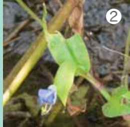
暑い時期（6～9月）に咲くツククサ