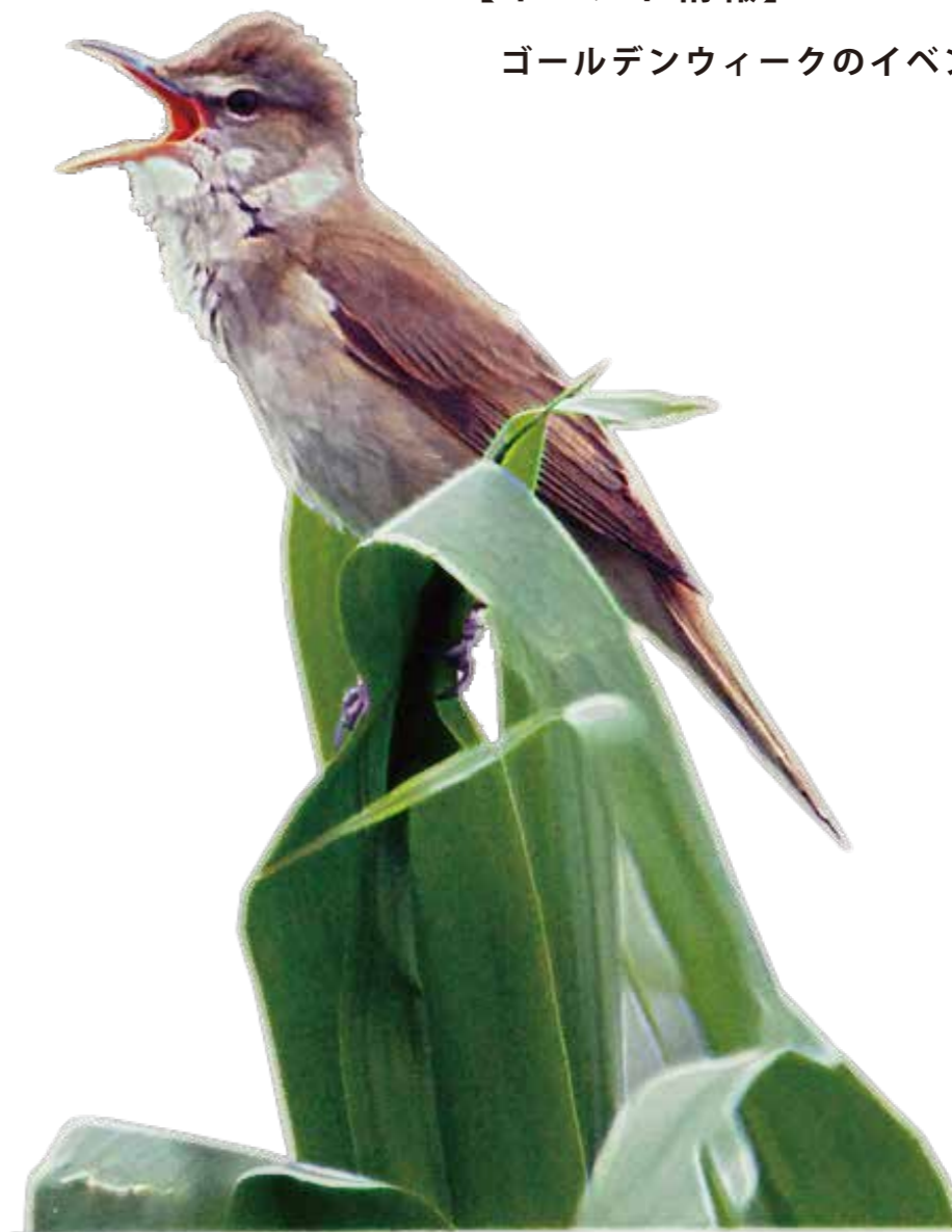
表紙の鳥 オオヨシキリ