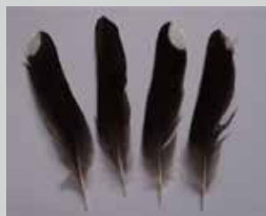
落ちていたムクドリの羽

公園内でギャーギャーというさい鳥がいると思い振り向くと、ハイタカが鳥を捕まえていました。そしてハクセキレイ二羽がこのハイタカを追い払おうと何度も向かって行っていました。ハイタカは公園内でばつが悪かったのか、捕まえていた鳥を放して、飛んでいってしまいました。ハイタカがいた場所に行ってみると、ムクドリの羽が落ちていました。ギャーギャーと騒いで命拾った鳥はムクドリのようなものでした。