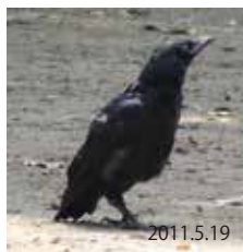
ハシボソガラスの幼鳥