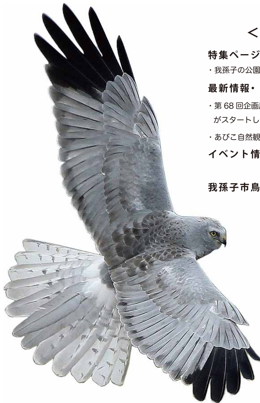
表紙の鳥 ハイイロチュウビ