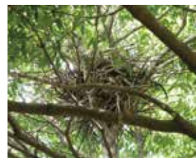
ハシボソガラスの巣