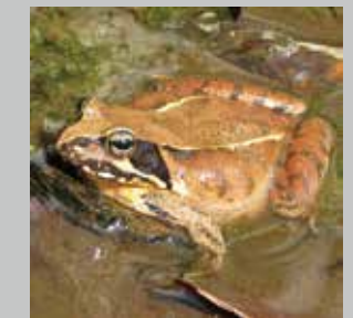
ニホンアカガエル