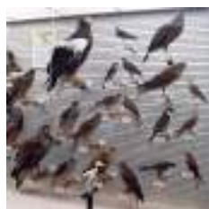
過去の展示の様子

鳥の博物館では、開館以来、日本産鳥類全種の剥製標本の収集を進めており、現在までにその6割ほどにあたる389種の標本を収蔵しています。日本の鳥コーナーでは、これらの標本をできるだけ多く展示し、地域や環境、季節によっても異なる日本の鳥の多様性をご紹介します。