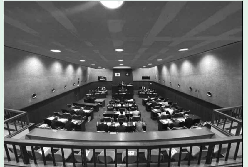
本会議が行われる議場

我孫子市議会では一般質問の映像をインターネットで生・録画中継を行っています。閲覧方法などは3面「インターネットで議会中継や会議録をご覧ください」をご参照ください。