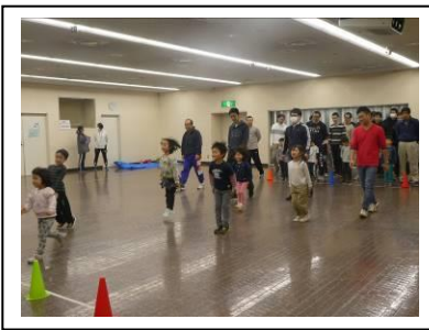
走る動作はジャンプの繰り返しです。 ジャンプのフォームを意識して進みます。