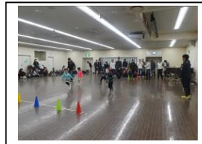
最後の総仕上げ。 走り方のフォームが変わりました！