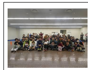
第一部終了！ みんないい笑顔でした。