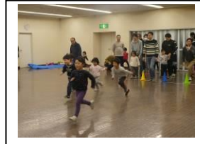
最後の総仕上げ。 思い切り走り、楽しそうな子ども達！