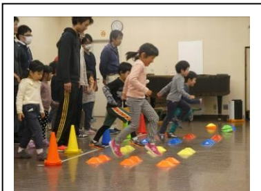
脚を上げる練習。 姿勢がよくなりきれいな走り方になりました。