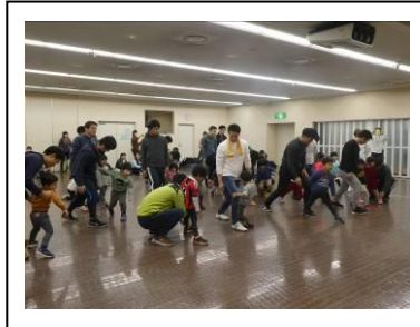
準備体操で体をほぐします