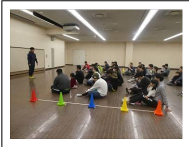
第一部スタート。 パパと一緒に座り嬉しそうな子ども達。