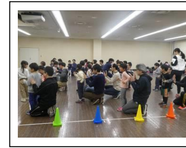
腕振りの練習かパパとペアに なって行います。