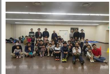
第2部終了！ 子育てのちょっとしたアドバイス も伝授してくれました。