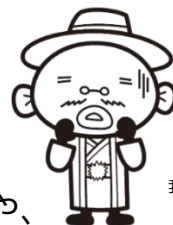
我孫子市マスコットキャラクター 手賀沼のうなぎちゃん

受動喫煙との関連が「確実」と判定された肺がん、虚血性心疾患、脳卒中、乳児突然死症候群（SIDS）の4疾患について、超過死亡数を推定した結果によると、わが国では年間約1万5千人が受動喫煙で死亡しており、健康影響は深刻です。