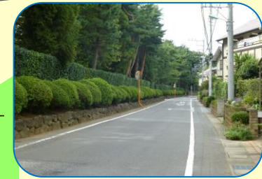
2 日立アカデミー 我孫子キャンパス周辺