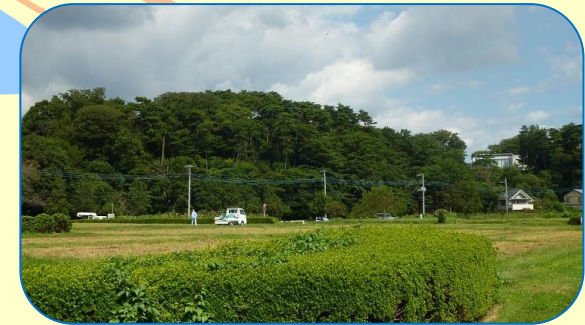
6 高野山桃山公園・日立の森