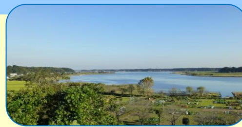
9 高野山桃山公園・前原古墳から見た手賀沼