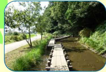
5 高野山新田ビオトープの道