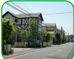
2 東我孫子のまちなみ