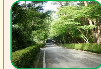
我孫子ゴルフ倶楽部へのアプローチ