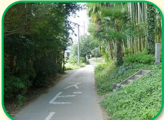
4 岡発戸のお遍路道