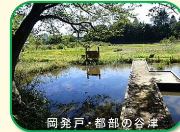
岡発戸・都部の谷津