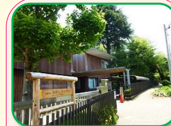
8 近隣センターこもれび