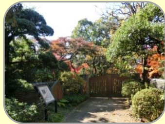
11 旧武者小路実篤邸跡