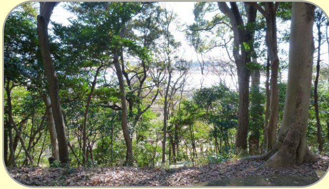
12 根戸船戸緑地から見える手賀沼