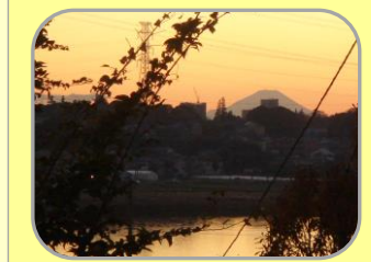
富士見坂から見える富士山