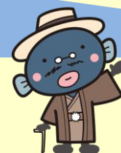
手賀沼のうなぎちゃん

我孫子のいろいろ八景歩き 白山のまちなみと船戸の森・湧き水の小径コース 発行 平成 28 年 10 月 第 1 刷発行 令和 4 年 10 月 第 4 刷発行 発行者 我孫子市都市計画課景観推進室 ☎04-7185-1111 (代表) 企画・編集 我孫子の景観を育てる会