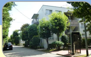
7 白山グリーントウン